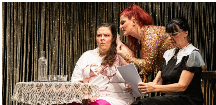
Ženitba (DK Jirásek)