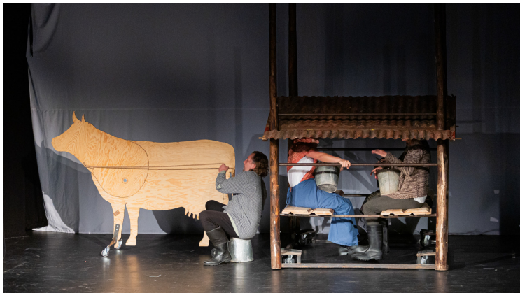
Nikoločava (V.A.D. Kladno)

mladoboleslavské Divadýlko na dlani nás vrátilo do časů vzniku prvních filmů, jen na hru o legendární taneční kapele nezpěváků The Legend of The Lunetic jsme si museli pro nemoc počkat až do jara. O to větší úspěch pak představení mělo. Rozesmály nás inscenace Saturnin i domácí Ženitba, Uspávanka s plavčíkem a velrybou okouzila nejmenší, slovenský host s inscenací Neprebudený nám ukázal, že i z minimalistické, komorní, úsporné inscenace se dají vytěžit velké emoce. Bylo nám zkrátka moc dobře, tak jak tomu i díky vám bývá již desítky let.