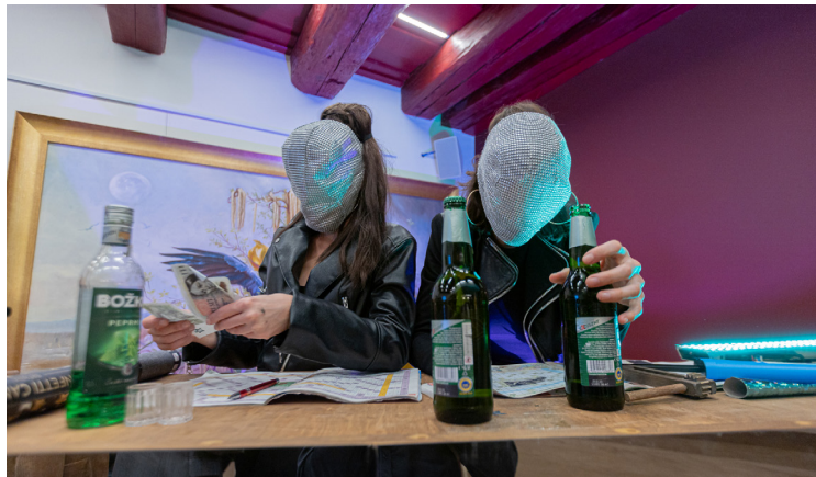
Discoland (Divadlo Na zábradlí)

Loňský ročník festivalu poprvé hostilo zrekonstruované Jiráskovo divadlo. Festival se tak po přechodném období rozkročeném mezi dvě města a tři sály vrátil na domácí prkna. V programu rezonovalo především dokumentární divadlo v rozličných podobách. Divadlo Na zábradlí nám připomnělo mafiánská 90. léta ve hře Discoland, kladenští V. A. D. zase mytický život zbojníka Nikoly v realistických konturách současné ukrajinské Koločavy,