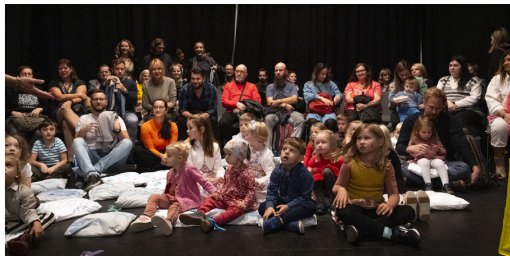
Dětské publikum – Uspávanka s plavčíkem a velrybou