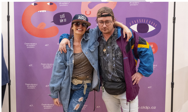
Páteční disco ve stylu 90. let

mladoboleslavské Divadýlko na dlani nás vrátilo do časů vzniku prvních filmů, jen na hru o legendární taneční kapele nezpěváků The Legend of The Lunetic jsme si museli pro nemoc počkat až do jara. O to větší úspěch pak představení mělo. Rozesmály nás inscenace Saturnin i domácí Ženitba, Uspávanka s plavčíkem a velrybou okouzila nejmenší, slovenský host s inscenací Neprebudený nám ukázal, že i z minimalistické, komorní, úsporné inscenace se dají vytěžit velké emoce. Bylo nám zkrátka moc dobře, tak jak tomu i díky vám bývá již desítky let.