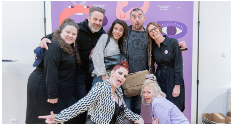
Focení u fotostěny se soubory